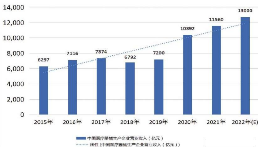
中国医疗器械生产企业营业收入及发展趋势

据南方医药经济研究所分析，2022 年我国医疗器械市场规模预计达到 1.3 万亿元，2015 年至 2021 年，我国医疗器械产业营业收入年均复合增长率为 10.65%，2022 年预计增速达 12%，显著高于医药工业整体增速。中国医疗器械市场已占全球市场的 27.5%，成为全球医疗器械第二大市场，产业发展形势向好，产业集聚度、国际竞争力不断提升。